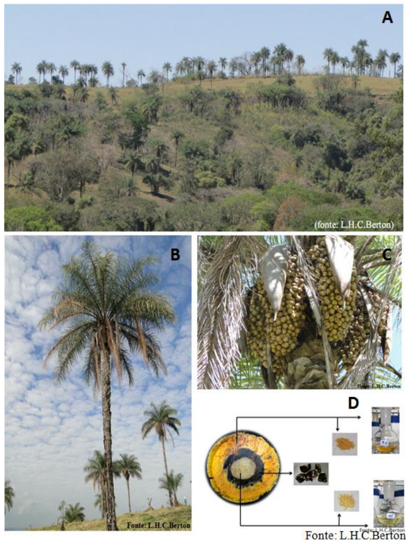
Figura 1. A: População natural de macaúba; B: Planta adulta; C: Cachos com produção de frutos e D: Corte transversal do fruto da macaúba (setas indicando alguns dos derivados de cada componente do fruto) Ex. Endocarpo, farinha e óleo do mesocarpo e endosperma.

macaúba utilizado é oriundo do extrativismo de plantas ou populações naturais. Em São Paulo, o coco era comercializado por agricultores familiares, na década de 50, para a Indústria Paulista de Óleo em Mogi-Mirim para produção de óleo e seus sub-produtos (Novaes, 1952). Em Minas Gerais, três indústrias de processamento de coco de macaúba operavam próximo a Belo Horizonte e outras pelo interior do estado (Brasil, 1985) com a finalidade de produção de sabão. Atualmente, existem quatro indústrias operantes no Estado: Cocal do Brasil, Paradigma Óleos, UBCM-Montes Claros e UBCM-Luz (Motoike et al., 2012). Em Mato Grosso do Sul, comunidades locais utilizam as distintas partes de Acrocomia aculeata de nove maneiras distintas, com destaque para o uso medicinal e alimentício (Lorenzi,2006).